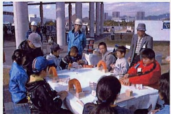
ティピーでは、ブロック・アーチ橋の組立て遊びをやっています。